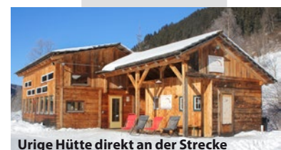
Urige Hütte direkt an der Strecke