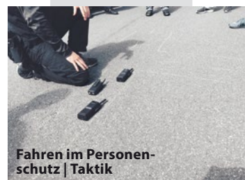
Fahren im Personenschutz | Taktik