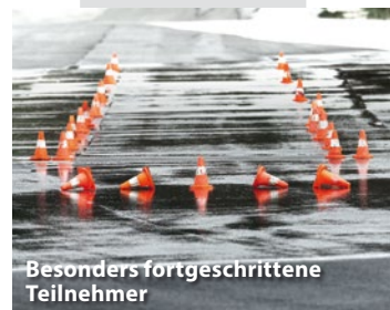
Besonders fortgeschrittene Teilnehmer