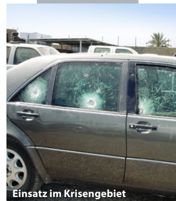
Einsatz im Krisengebiet