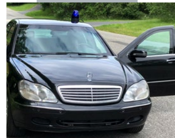
S600L Guard (V220)

202. Landmann Training Sa. 22. und So. 23. Oktober 2022 Fahren mit Sonderschutzfahrzeugen (€ 1.650,00 zzgl. MwSt.)